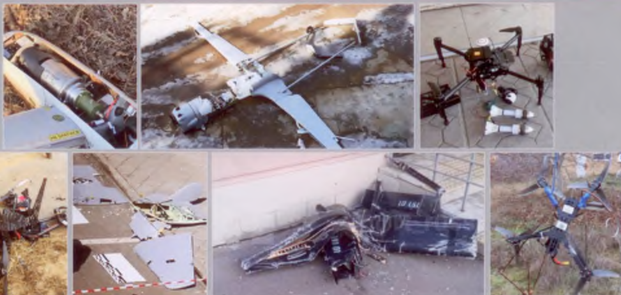
Фотографии обломков/фрагментов БПЛА

При поддержке Антитеррористической комиссии в Ульяновской области